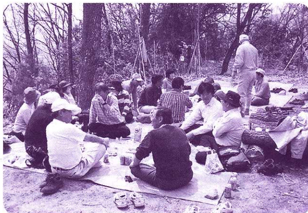
茶臼山頂上でのお花見

ここ茶臼山は、市内中心部からも近く、気軽に訪れることができます。海拔200.2mで、登山客も多く、地元以外の方にも、楽しんでもらえる山となっています。JR西広島駅から茶臼山の頂上まで、徒歩約40分。一度訪れてみられても良いかもしれません。