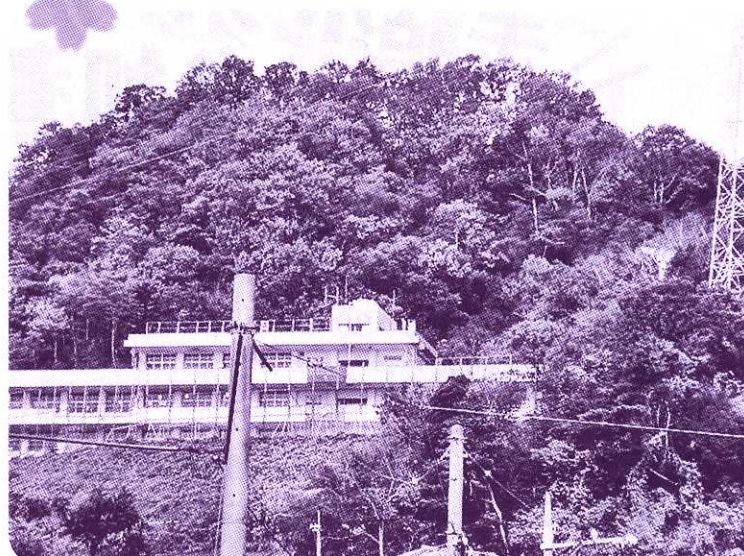
己斐東小学校の裏にそびえる茶臼山

※「やあこんにちは!」で取り上げたい西区内の人・モノ・団体等がありましたら、西区社会福祉協議会まで情報をお寄せ下さい。この広報紙は共同募金配布金により作成しました。